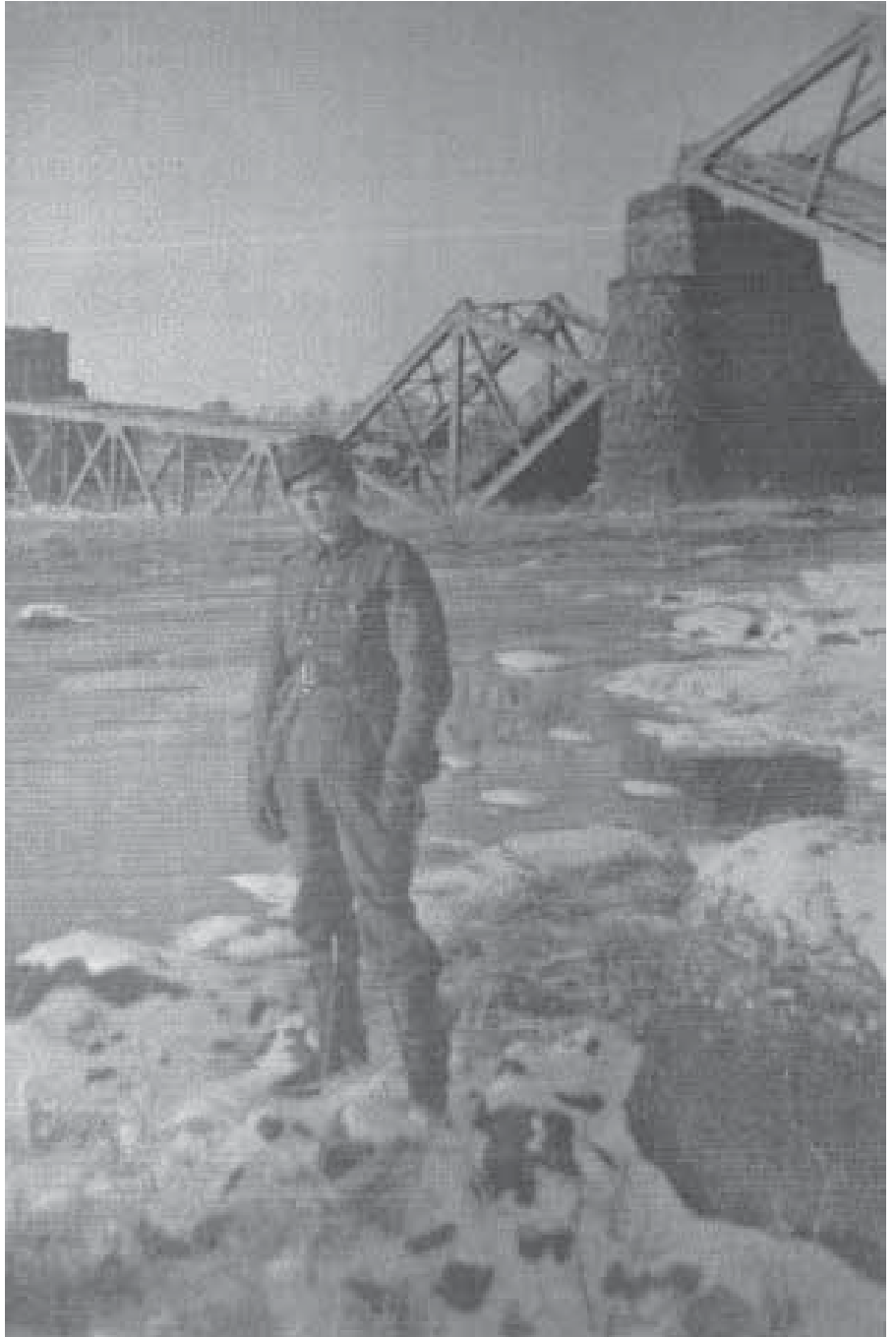
Oulusta tuhottuun Lappiin, taustalla räjäytetty Rovaniemen silta.

- Tammikuun puolella päättyi minun Lapin sotani, mutta sitten oli edessä vuoden varsinainen asepalvelus Parolassa.