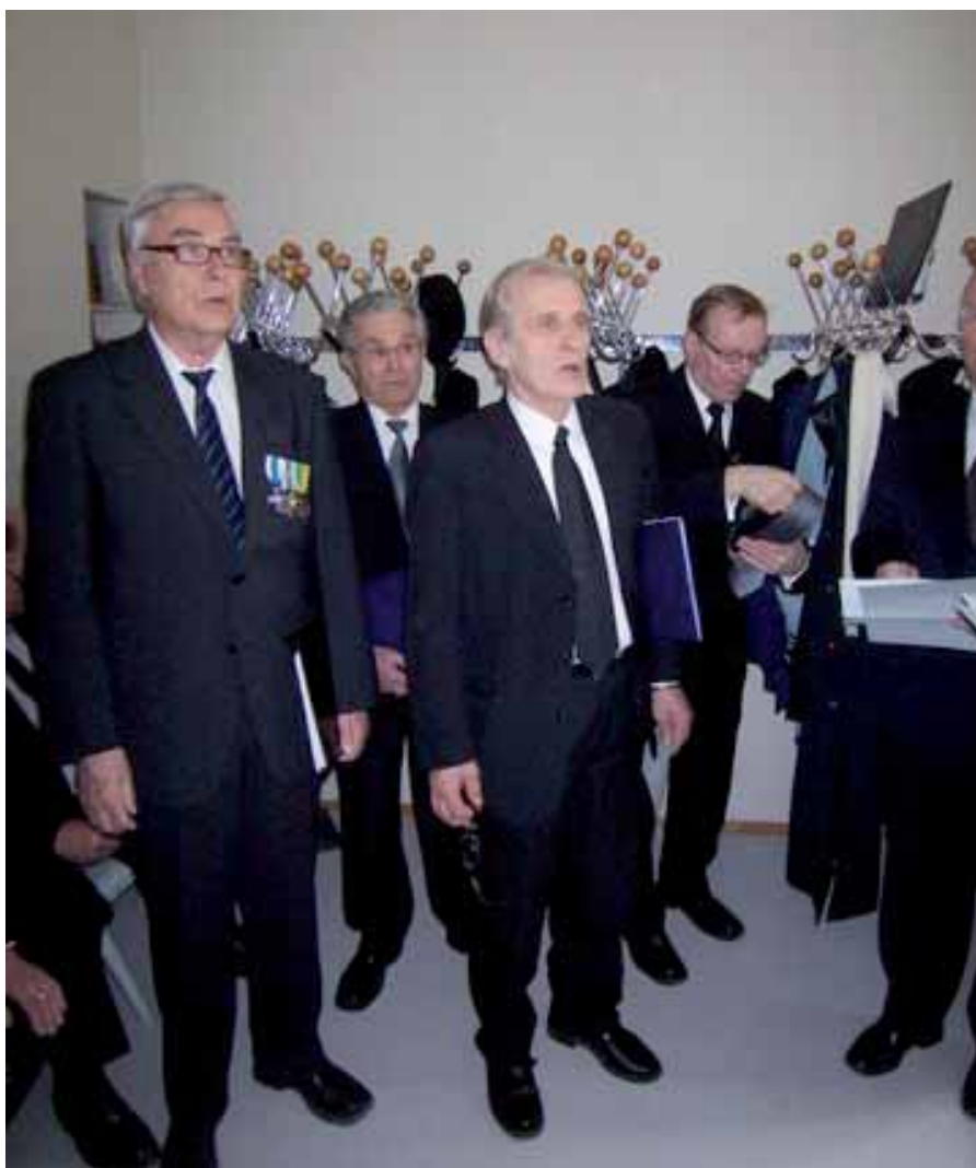
Yhdistyksen ja yhteistyökumppaneiden esiintymisiä on vuosittain toista kymmentä.

Kuoro on esiintynyt perinteisesti niin yhdistyksen kuin myös sen eri