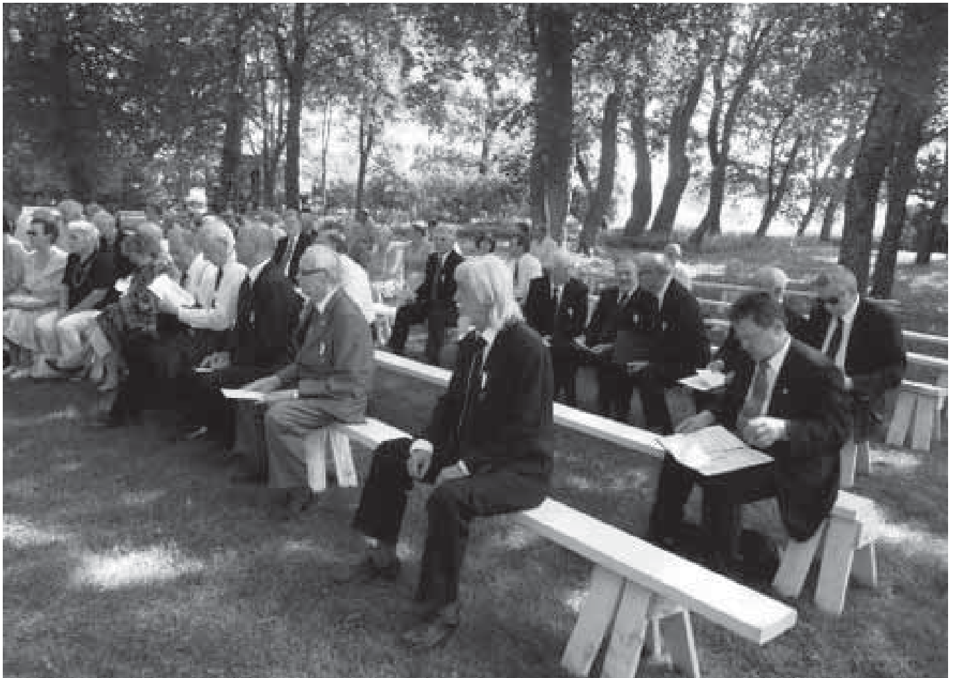
Kesäkuiset Askaisten juhlallisuudet luokitellaan etuoikeutettujen esiintymisiksi.