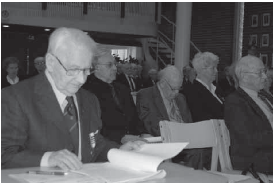
Vuosikokous pidettiin jälleen seurakuntayhtymän salissa.