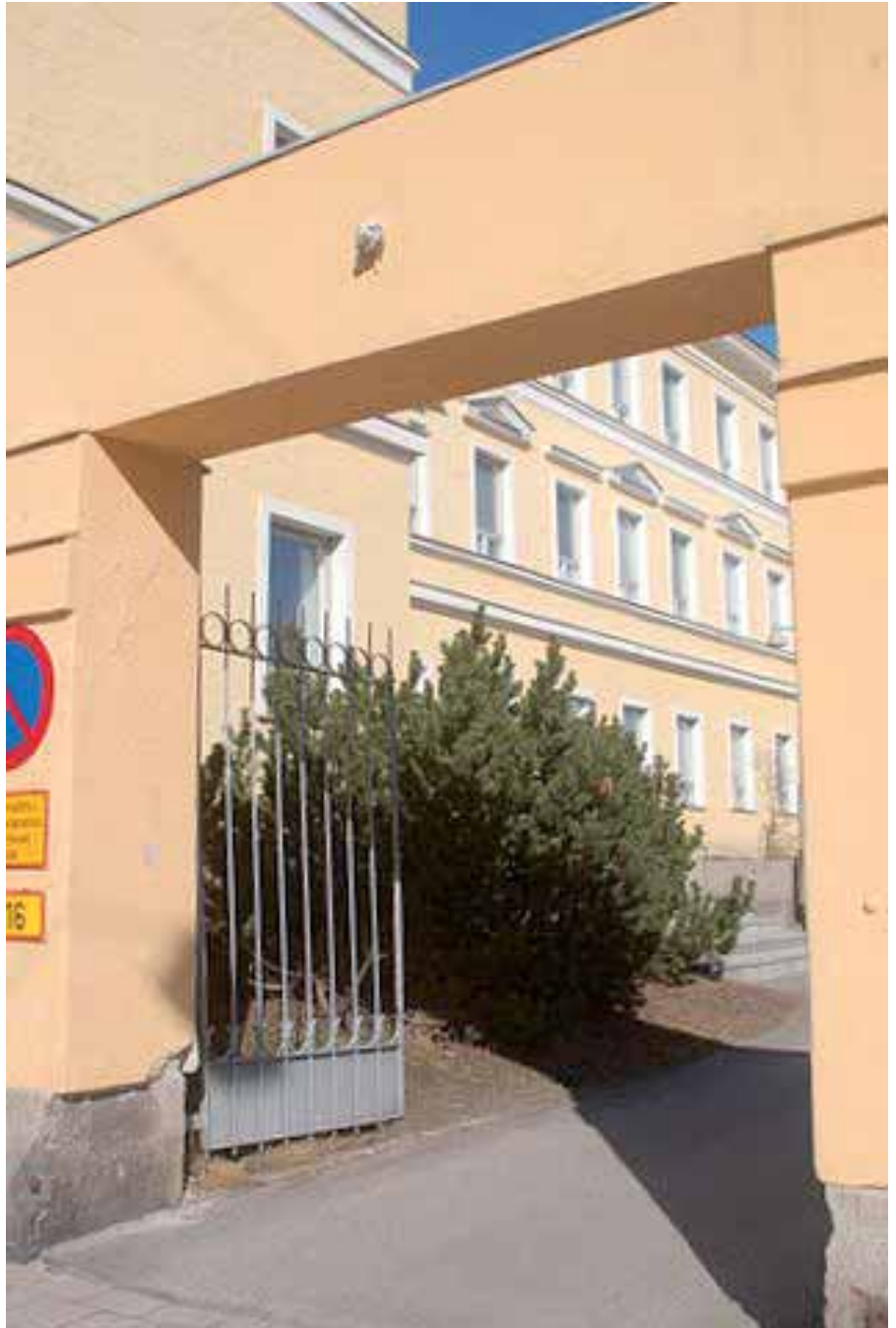
Sirkkala on siirtynyt yliopistolaisille.

Lotta-patsas puolestaan tuo mieleen naisten tärkeän osuuden maanpuo-