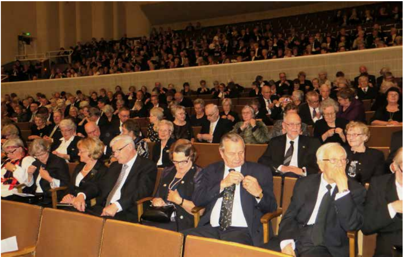
Historiallinen hetki, sotaorpotunnuksen kiinnittäminen.

liikkein ilmaistiin rukousta ja kiitosta Jumalalle.