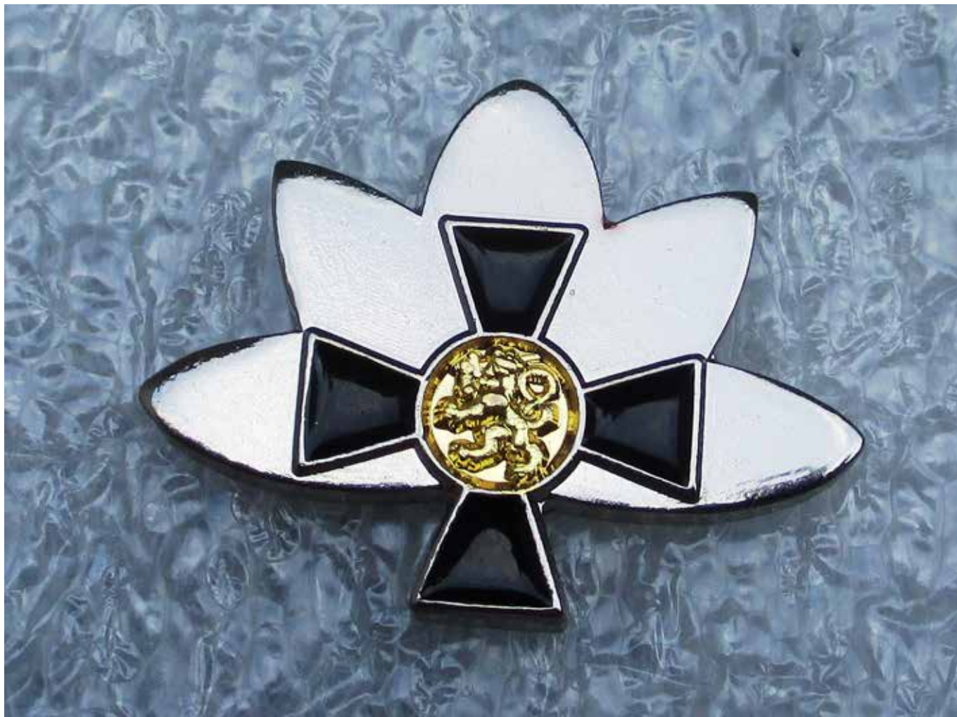
SOTAORPOTUNNUS suunnitellut taiteilija Aimo Vuorinen